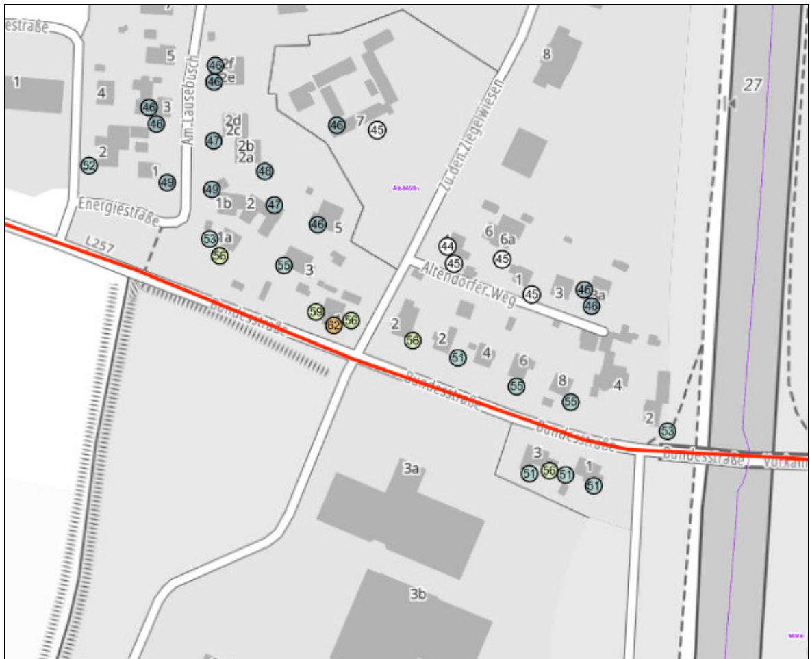
Abbildung 1: Fassadenpunkte L_{Night} L257 Alt-Mölln Quelle: Ausschnitt aus dem Geoportal Umgebungslärm 22

Grundsätzlich stellen die ermittelten Lärmpegel entsprechend den Vorgaben für den Straßenverkehr A-bewertete äquivalente Dauerschallpegel (Mittelungspegel) dar. Der Mittelungspegel wird bei zeitlich schwankenden Geräuschsituationen verwendet. Einzelereignisse wie z.B. einzelne laute Fahrzeuge können durchaus lautere Pegel erzeugen. Solche Einzelereignisse werden überproportional im Mittelungspegel berücksichtigt.